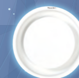
NÉO 2000 Diffuseur circulaire à effet Coanda Débit max. : 1600 m 3 /h 4 tailles HSP : 2,6 - 3 m