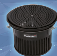
DDS INDUCTION Bouche de sol tourbillonnaire 3 tailles : diamètres 200 à 250 mm Débit max. : 160 m 3 /h