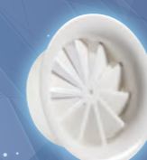
DFK Diffuseur tourbillonnaire à pales fixes Diamètres 220 à 530 mm Débit max. : 700 m 3 /h HSP max. : 2,6 - 4 m