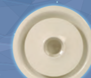
NÉO 100 Diffuseur circulaire à 100 % d'induction interne Débit max. : 1600 m 3 /h 5 tailles HSP : 2,6 - 3 m