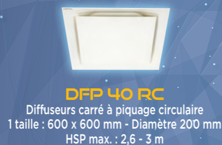
DFP 40 RC Diffuseurs carré à piquage circulaire 1 taille : 600 x 600 mm - Diamètre 200 mm HSP max. : 2,6 - 3 m