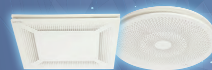
DESIGN'AIR Q ET DESIGN'AIR C Diffuseur carré et rond design 4 tailles Débit max. : 1000 m 3 /h HSP : 2,6 - 3 m